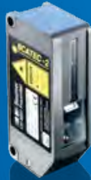
SCATEC-2 Box Der Verpackungsmeister.