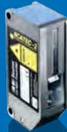
SCATEC-2 Gripper Der Greiferspezialist.