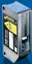
SCATEC-J Das Einsteigermodell.