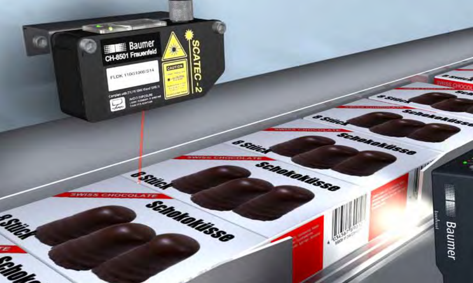
Einzelverpackungsdetektion bei lückenloser Produktförderung.