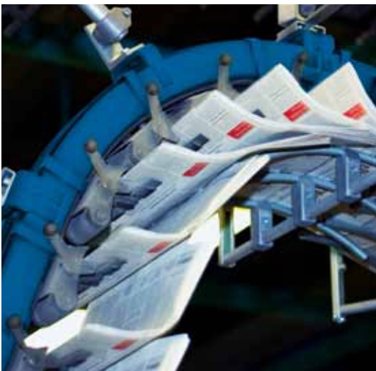
Exemplarzählung im Greifertransport.

Mit SCATEC überwachen Sie Ihre Produktion schnell, fehlerfrei und präzise.