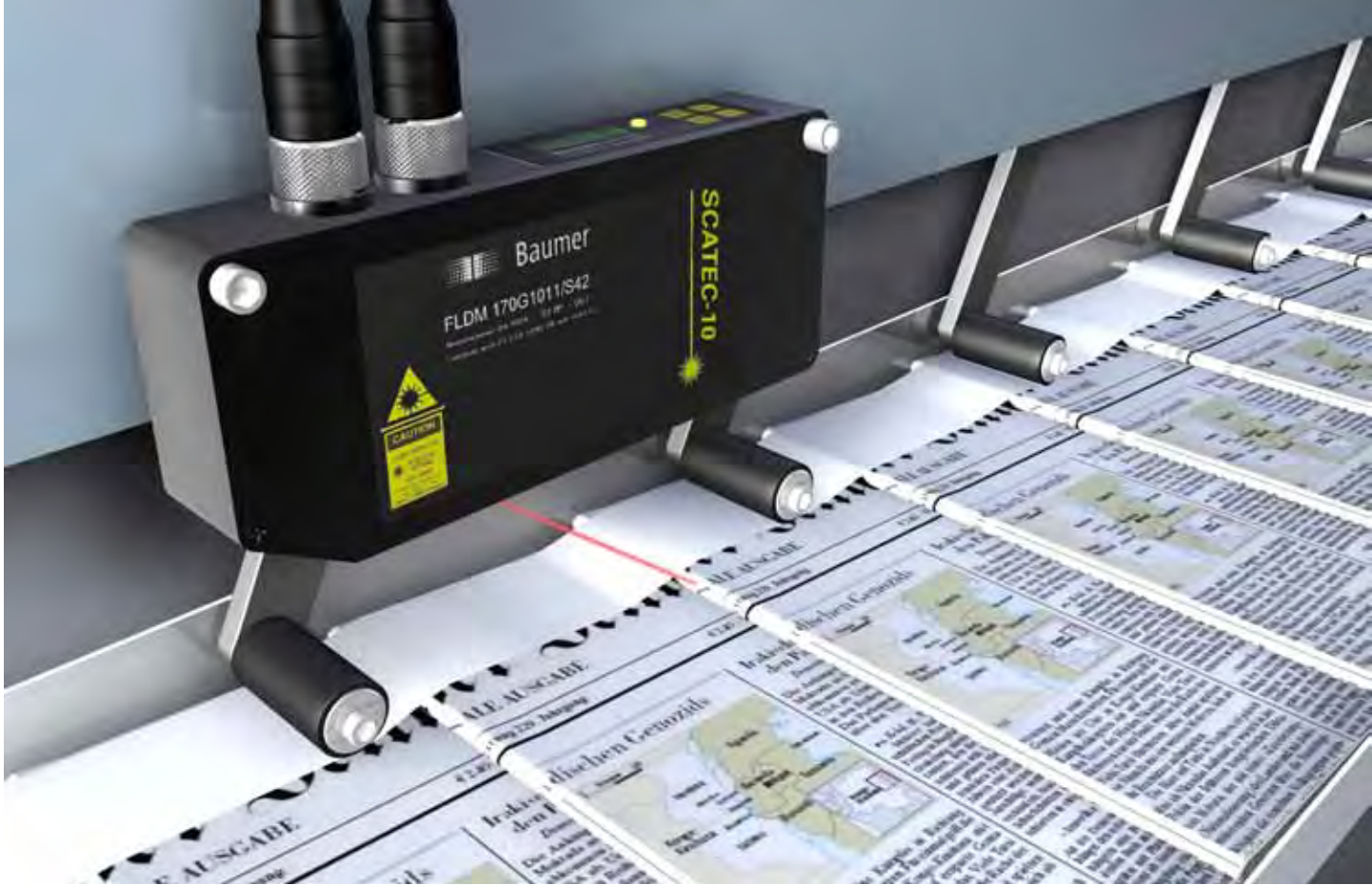
Exemplarzählung im Schuppenstrom.