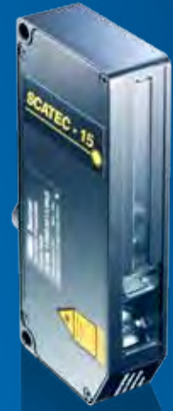
SCATEC-15 Die Präzisionsklasse mit CAN-Bus.