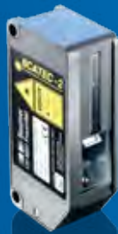
SCATEC-2 Der Meistverkaufte.