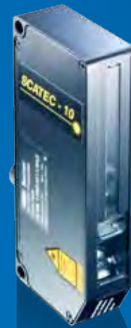
SCATEC-10 Die Präzisionsklasse.