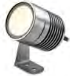
clarios (Edelstahl • stainless steel • acier inoxydable)