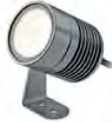
clarios (Aluminium • aluminium • aluminium)