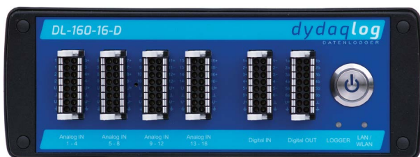
dydaqlog mit 16 analogen Eingängen, digitalen I/O und leistungsfähigem ARM® Prozessor

Jeder dydaqlog Datenlogger ist gleichzeitig ein leistungsfähiger Webserver. Alle Funktionen sind über die moderne Weboberfläche in einem Browser einzurichten und zu verwalten. Messdaten können komfortabel on- oder offline dargestellt werden. Ein komfortabler Editor ermöglicht die Gestaltung aussagekräftiger und eleganter Reports.