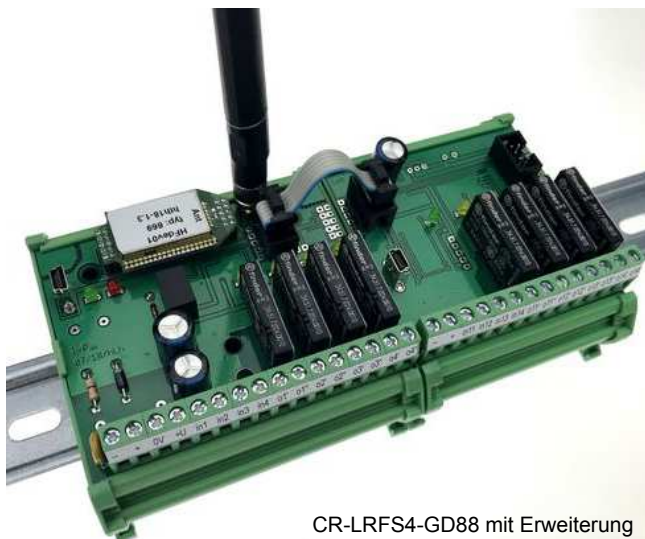
CR-LRFS4-GD88 mit Erweiterung