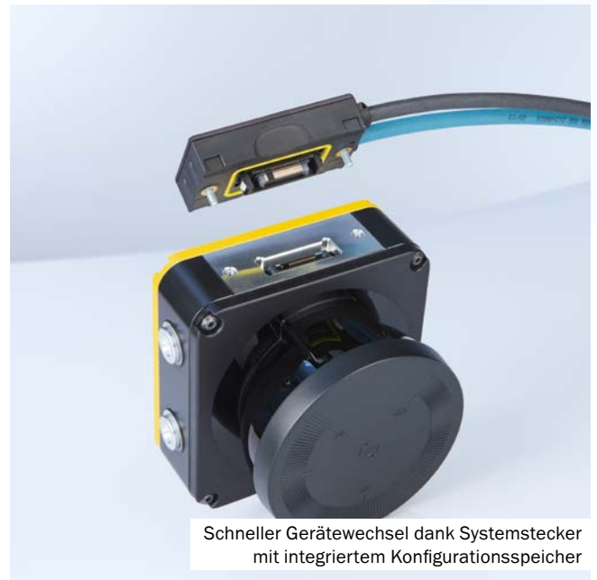
Schneller Gerätewechsel dank Systemstecker mit integriertem Konfigurationsspeicher