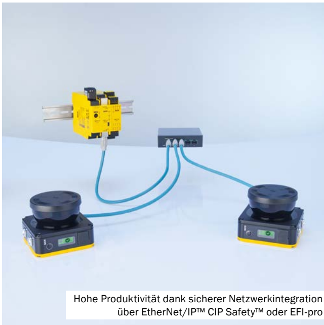
Hohe Produktivität dank sicherer Netzwerkintegration über EtherNet/IP™ CIP Safety™ oder EFI-pro