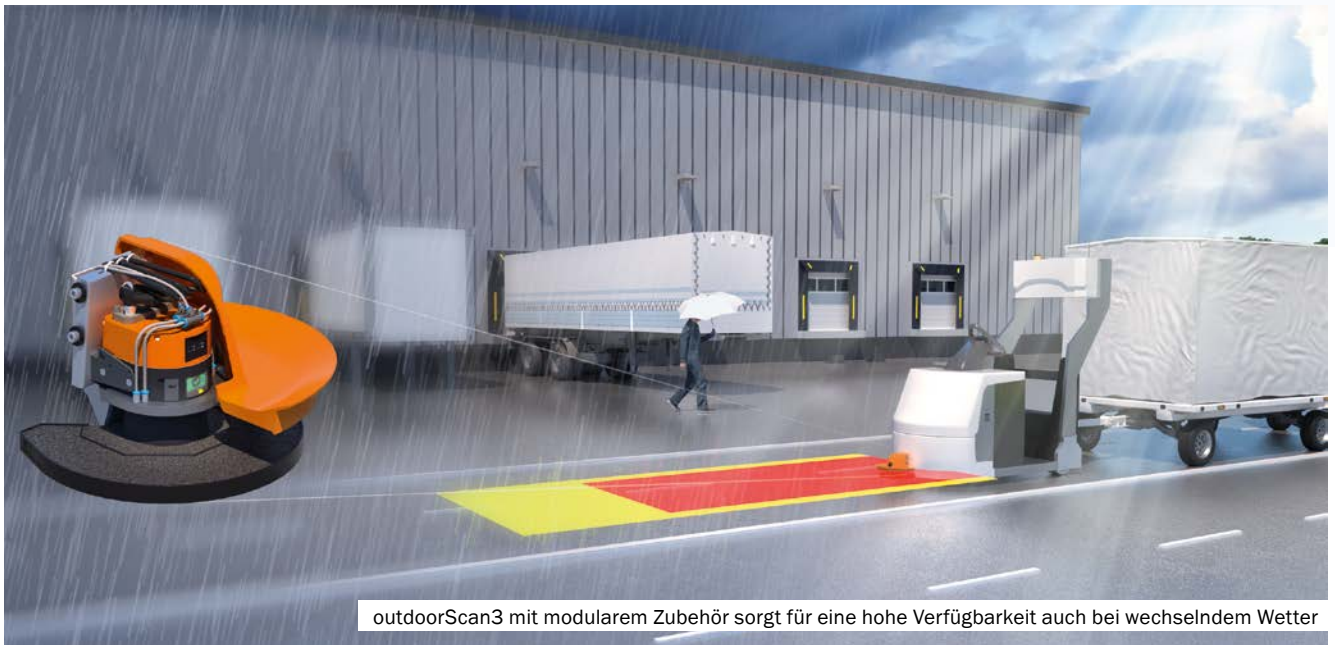
outdoorScan3 mit modularelem Zubehör sorgt für eine hohe Verfügbarkeit auch bei wechselndem Wetter